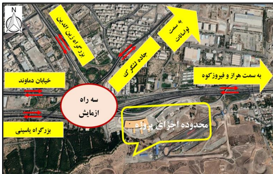
تصویر ۲: شبکه معابر در محدوده پایانه شرق جدید

در تمامی مطالعات اسناد فرادست، در راستای دستیابی به الگوی گسترش فضایی و پایدار در منطقه ۱۳ شهر تهران به‌قرارگیری سرخه حصار به‌عنوان قطب گردشگری و افزایش فضای مختلط برای افزایش توسعه، توسعه حمل‌ونقل عمومی، اصلاح ساختار و سلسله‌مراتب شبکه‌های ارتباطی، افزایش سطوح شبکه در رده شریانی، توزیع تراکم ساختمانی مناسب با ساختار و سازمان فضایی